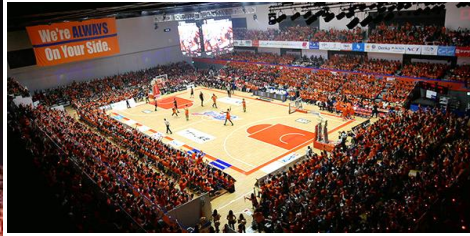
Basketball City NAGAOKA 「新潟アルビレックスBB」のホームタウンです